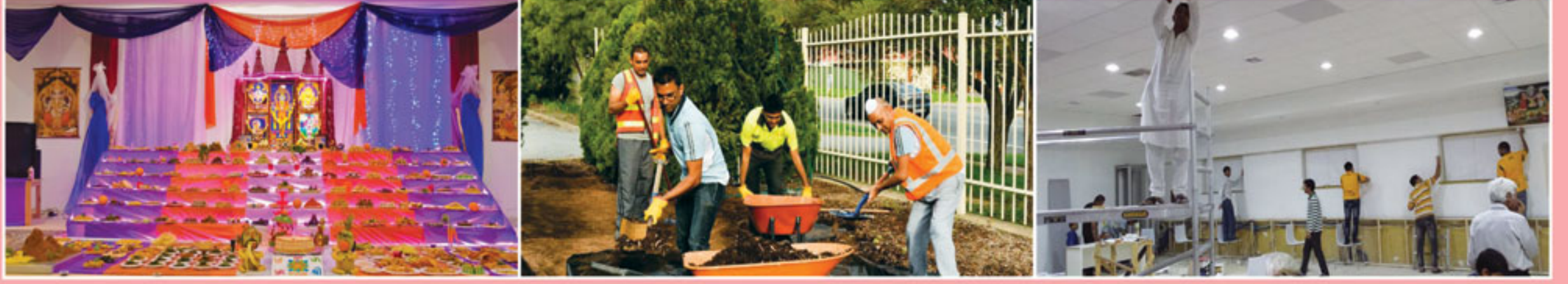
એડેલેઈડ મંદિરમાં અન્નકૂટ દર્શન તથા નૂતન મંદિરમાં સેવા કરતા યુવા ભક્તો