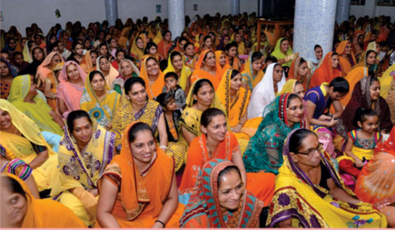
કથા શ્રવણ કરતાં બહેનો - નાઈરોબી