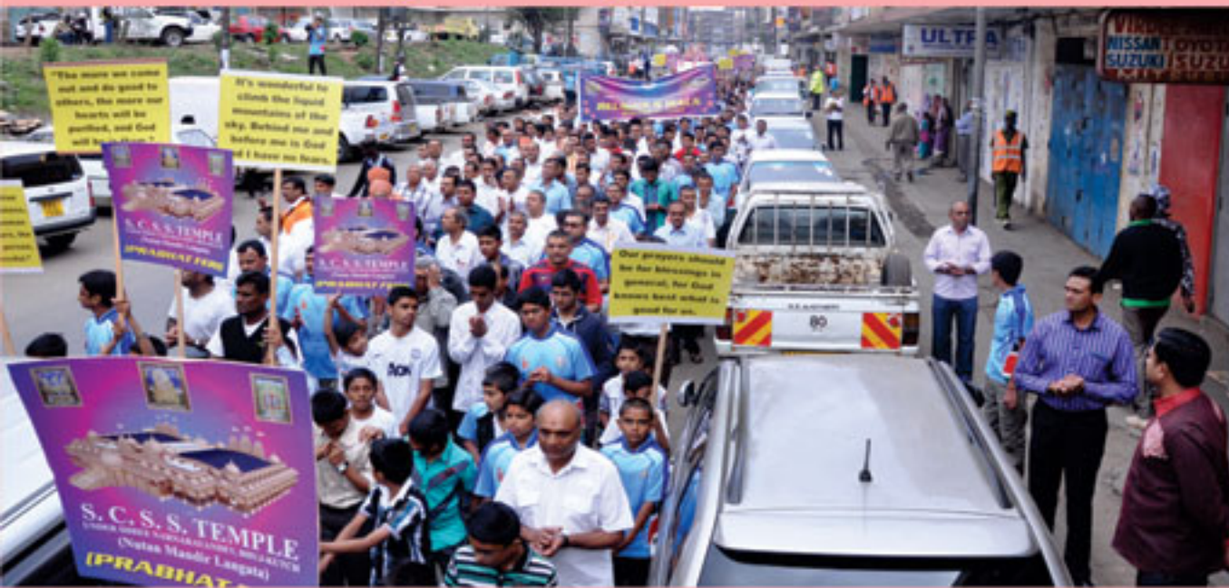
નૂતન મંદિર ઉપક્રમે પ્રભાતફેરી તેમજ નૂતન મંદિરનું પૂરજોશમાં ચાલતું બાંધકામ - નાઈરોબી