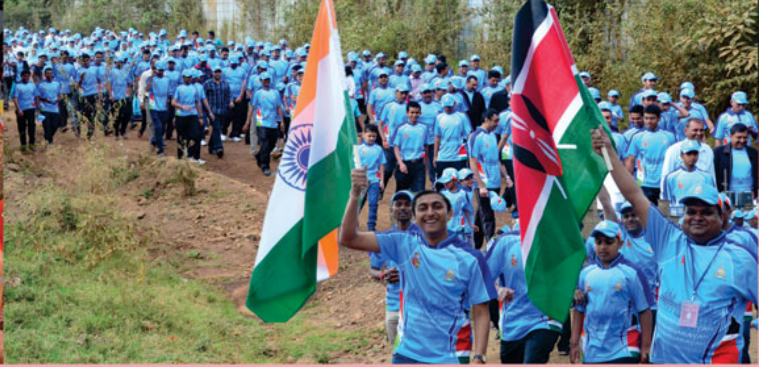
ચેરીટી વોક - નાઈરોબી