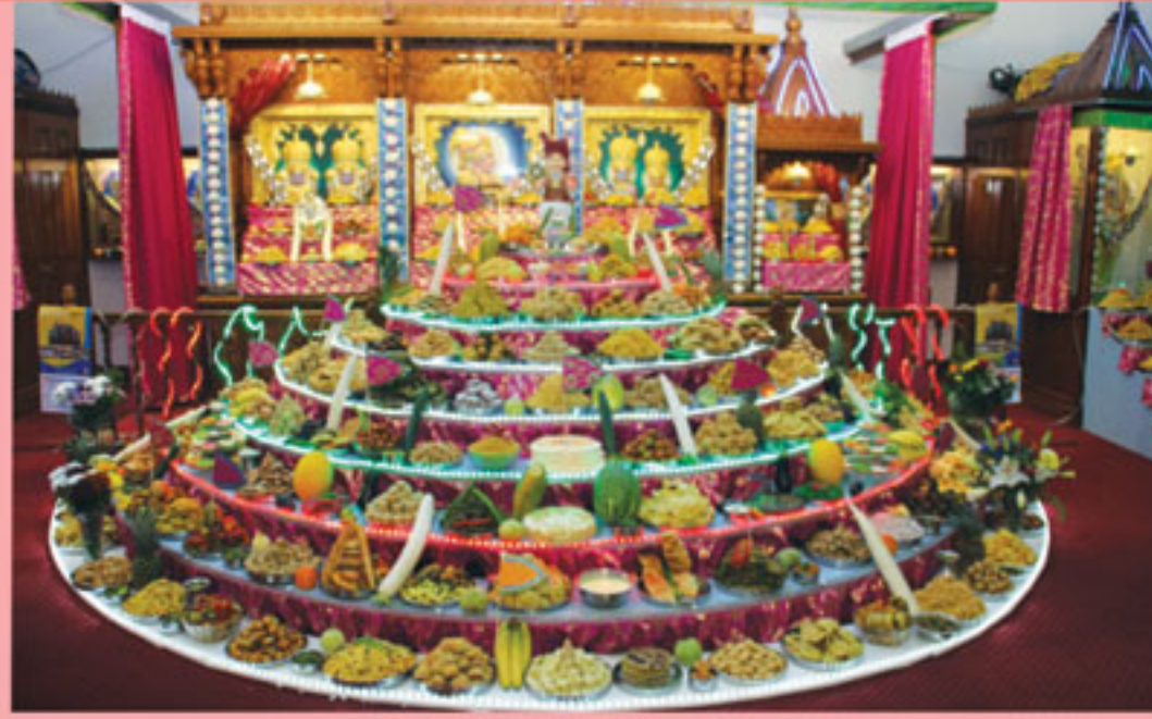
બોલ્ટન મંદિરમાં અન્નકૂટ દર્શન