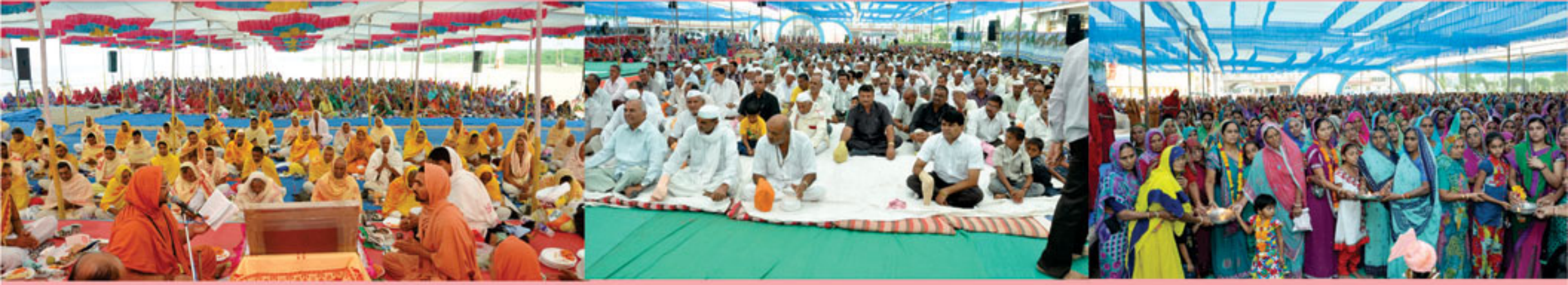
શ્રી સ્વામિનારાયણ મંદિર માંડવીમાં કથા પારાયણનું પૂજન તથા કથા શ્રવણ કરતા બહોળી સંખ્યામાં હરિભક્તો તથા બહેનો